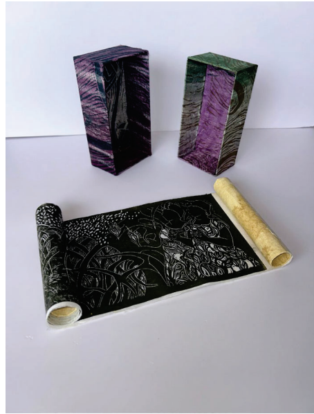
libro objeto de Arte 1 Lola Solís 2025