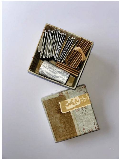
biblioteca portatil Lola Solis,2025

Estos libros realizados a lo largo de los últimos años post pandemia fueron estampados en sedas naturales, en lino, en gaza de algodón, en papel fibras de cabuya, abacá y otros hechos a mano. En papeles chinos, japoneses, italianos y franceses. Ellos guardan palabras-semillas, instantes capturados, deseos, sentires e historias bordadas.