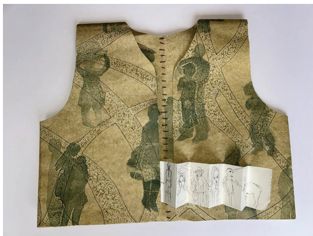
Te llevo conmigo Lola Solis, 2025