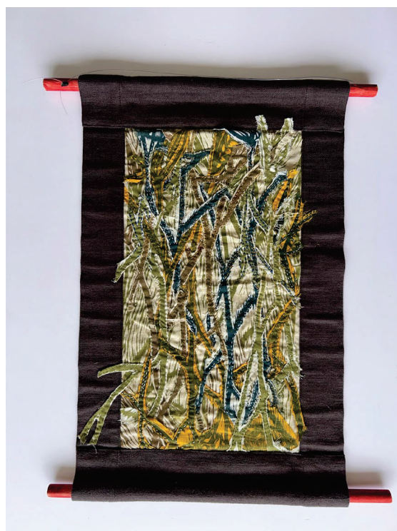
textil, s.t. Lola Solis, 2025