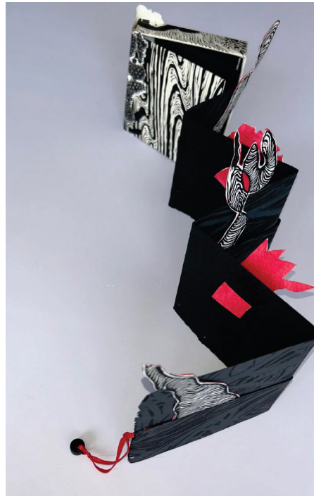
libro objeto de Arte 2 Lola Solís 2025